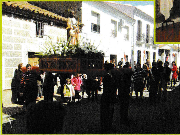
Entrega de vara de Mayordomo a Mayordomo entrante