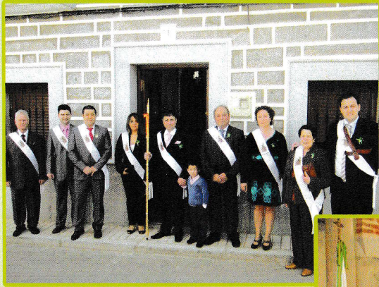
Recogida del Mayordomo por parte de la Junta Directiva