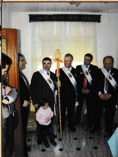
• Entrega de vara de Mayordomo a Mayordomo entrante →