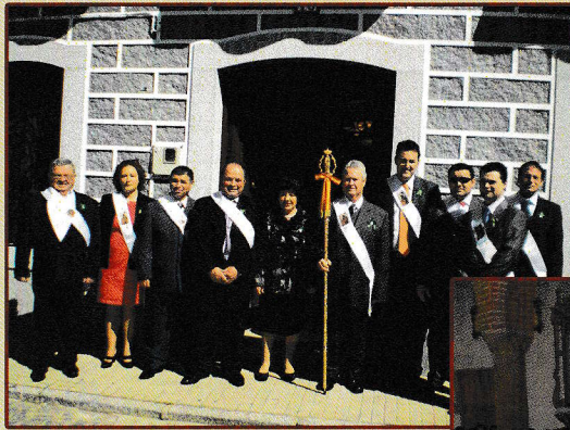
← Recogida del Mayordomo por parte de la Junta Directiva