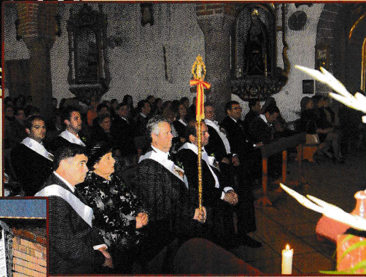
• Celebración de la Eucaristía →