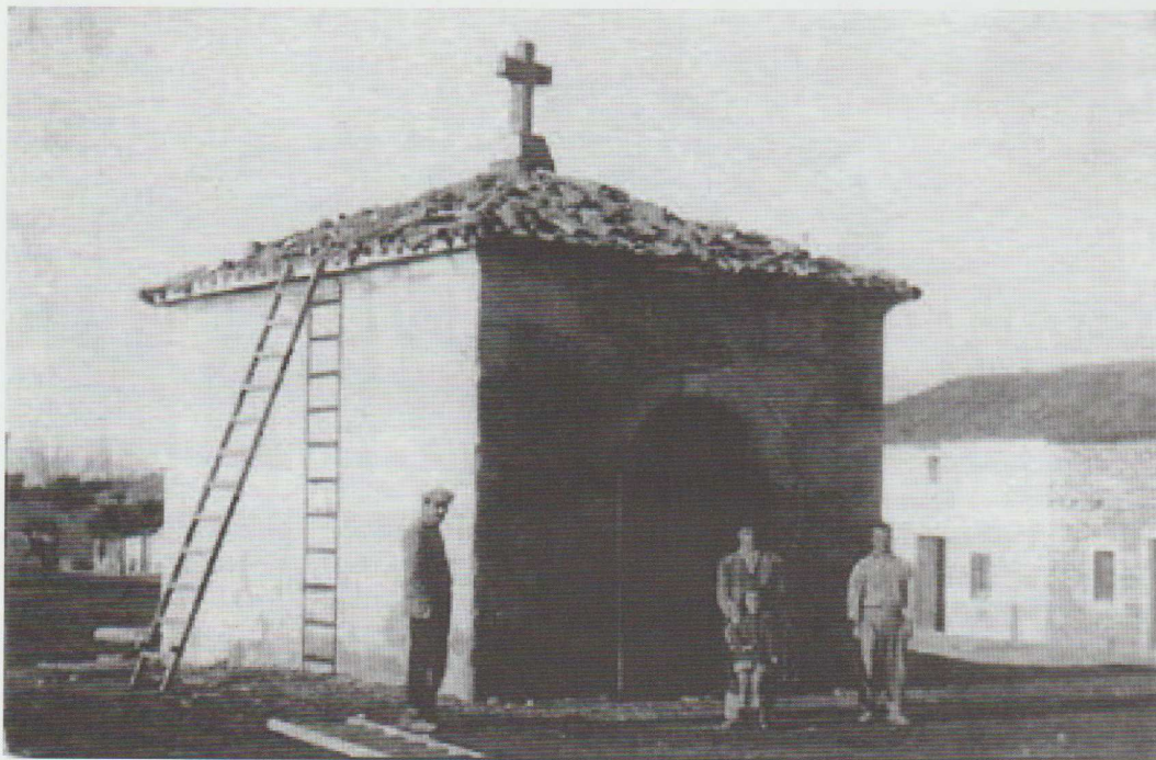
El Calvario, el día de su derribo (3-12-1962).

deleros de metal amarillo de regular tamaño". Esta ermita fue derribada, no he podido averiguar por qué motivo, en diciembre de 1962.